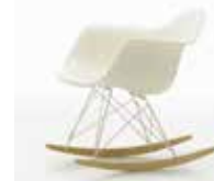
FAUTEUIL À BASCULE