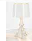
LAMPE BOURGIE TRANSPARENT